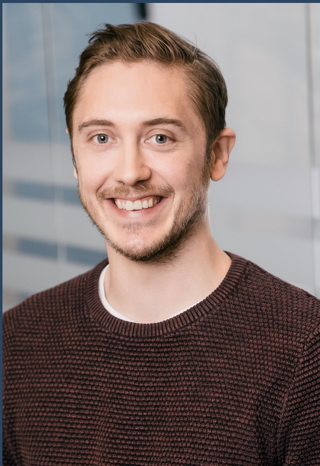
Betragtninger fra formanden

20.-21. marts 2020 Priser fra 995-1.995 kr.